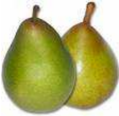
PYRUS comm. Beurre hardy DEMI-TIGE 8/10

Poire très renommée, à la chair fine et juteuse, sa peau vert-bronzé renferme un parfum puissant et savoureux.