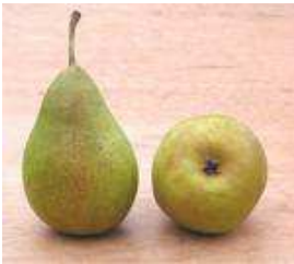
PYRUS comm. WILLIAM Bon chretien DEMI-TIGE 8/10

Gros fruit, jaune vert et gris, juteux et parfumé. Il est mature fin octobre début novembre.