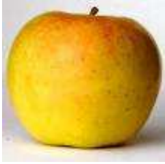
MALUS d. Coxs orange pippin DEMI-TIGE 8/10

Fruit assez gros, jaune saumoné, fin, fondant, sucré, parfumé. Il est mature en octobre.