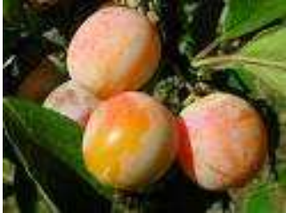
PRUNUS (pr) Mirabelle de nancy DEMI-TIGE 8/10

mirabelle jaune foncée, très concentrée en sucre qui dégage un parfum exceptionnel